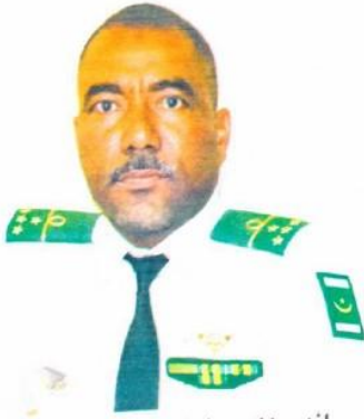
راند مهندس إسمووي مسعود

تعرضت موريتانيا ابتداء من سنة 2005 لسلسلة هجمات إرهابية خطيرة، استهدفت وحدات من الجيش الوطني في ثكنات لمغيطي والغلاوية وتورين، وقد شملت هذه الهجمات كذلك بعض المدن في داخل البلاد، في نواكشوط والاك والنعمة (انظر الصورة المرفقة).