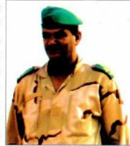
اللواء عثمان عبيد لحر

وبهذه المناسبة الحزينة فإن اللواء قائد المنطقة العسكرية الأولى والضباط وضباط الصف وجنود هذه التشكلة يقدمون تعازيهم إلى أفراد أسرة الفقيد وإلى المؤسسة العسكرية جمعاء راجين من الله أن يتغمده برحمته ويدخله فسيح جناته وإنا لله وإنا إليه راجعون.