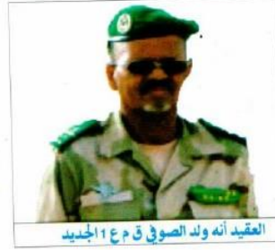
العقيد أنه ولد الصوفي ق م ع 11 الجديد

ترأس اللواء حننه ولد سيدي قائد الأركان العامة للجيش المساعد في أنواذيبو يوم 2015/12/11 حفل تبادل القيادة والمهام على مستوى المنطقة العسكرية الأولى.