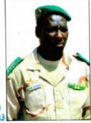
المقدم عبد الله ولد كلب قائد التجمع رقم 1 الجديد

أشرف اللواء حننه ولد سيدي قائد الأركان العامة للجيش المساعد يوم 2015/10/15 على حفل تبادل المهام والقيادة على مستوى التجمعين الخاصين للتدخل الأول والثالث.