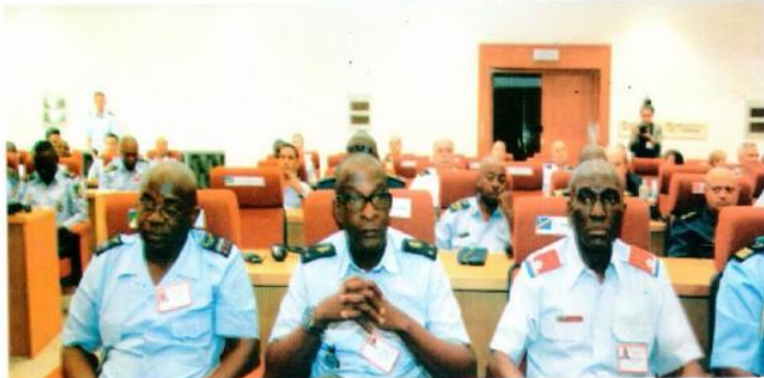
العدد 50 سبتمبر - أكتوبر 2015