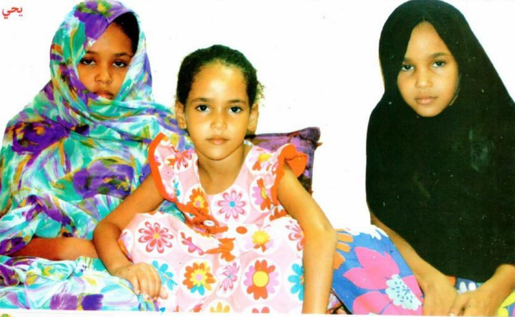
يحيي العدد 50 سبتمبر، أكتوبر 2015

(في إحدى لحظات التأمل والصفاء، وقف يستجلي معاني اللحظة الحبلية...تملكته الذكرى وتاه في دروب الماضي القريب... تراءى له طيف الشهيد يطل من بين الشخوص اللاهثة... إنه هو.. هو بدون شك... كان متدثرا في ثياب بيضاء وتعلو وجهه الوضاء ابتسامة خفيفة، تتم عن سعاده بعودته في هذا اليوم المشهود...مشى بخطوات متناقلة ومطمئنة، تفقد المكان، طاف في أرجائه، تواري في الدروب والمسالك والمنعطفات، حيي الحضور وتوقف كثيرا أمام وجوه سمراء ضامرة، أثقلت كواهلها السنون، وبذلت مهجها في هذا الأتون الصاخب الملتهب، فقد شاطرهم مرارة المعاناة وحلاوة الوفاء بالأمانة، أبطال مجهولون يذكركم جيدا ويذكرونه، لقد كان للشهيد هنا ذكريات وحكايا مع الإنسان والمكان..