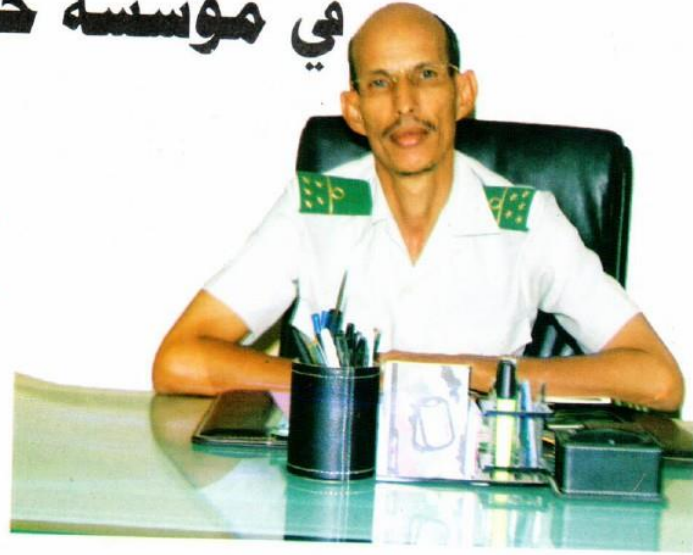
معتد عقيد الطالب ولد الطالب مدير مؤسسة خياطة الملابس

وعموما، تؤدي النساء العسكريات في المؤسسة عملهن بإخلاص وجدية، من أجل تحقيق النتائج المطلوبة، والتكيف مع الواقع العسكري والمهني. - "أخبار الجيش": يوجد رجال، وإن بنسبة قليلة يعملون إلى جانب النساء، هل هناك فارق في المردودية بين الجنسين؟ - العقيد مدير مصنع الملابس: يظل العمل في الورشات عملا جماعيا في إطار مجموعات عمل، ولا تقاس المردودية إلا على هذا الأساس الجماعي، وبالتالي فلا توجد إمكانية لتمييز عمل عنصر عن عنصر آخر في مجال المردودية. - "أخبار الجيش": من المعلوم أن دوام المصنع يبدأ من الساعة الثامنة صباحا وحتى الخامسة مساء، ما هي الظروف والخدمات التي توفرونها للعاملات خلال هذا الدوام الطويل؟ - العقيد مدير مصنع الملابس: يسير المصنع على نفس النظم والمناهج التي تتبعها مصانع الخياطة في العالم، ولأن هذه المصانع تتميز بالدقة والصرامة في العمل، فإنها توفر في المقابل خدمات خاصة. ويمكننا أن نذكر في هذا المجال أن المصنع يوفر خلال هذا الدوام ثلاث استراحات، يحصل خلالها العاملون في المصنع على إعاشة ذات جودة، تتمثل في فطور صباحي وغداء عند الزوال، وعلاوة معتبرة خاصة بالعاملين في الورشات. كما يستفيدون من رعاية صحية دائمة وخطوط اتصال هاتفي مجانية للاتصال بذويهم عند الاقتضاء. كما يراعي المصنع خصوصية النساء العسكريات حيث يوفر لهن مرابض خاصة وأماكن لتبديل الملابس، كما أن الجانب الأمني والرقابي