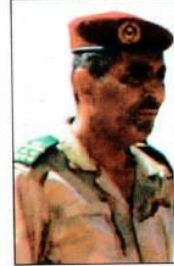
العقيد محمد ولد دشق قائد المركز الجديد

أشرف اللواء حننه ولد سيدي قائد الأركان العامة للجيش المساعد يوم 2015/10/11 في مدينة أنبيكة على تبادل المهام والقيادة على مستوى المركز الوطني لتكوين المغاوير.