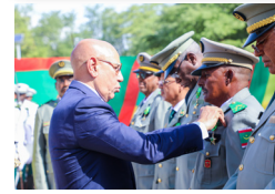
العقيد محمد المصطفى يب، قائد الثانوية العسكرية بنواكشوط،