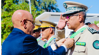
اللواء سليمان أحمد أبوده الأمين العام لوزارة الدفاع الوطني،