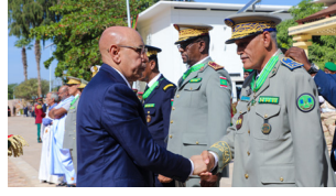
اللواء ختار محمد أمبارك مدير للحماية المدنية،