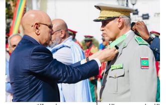
اللواء حبيب الله أحمدو، مساعد قائد الأركان العامة للجيش،