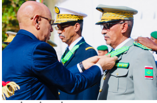
اللواء محمد محمد المختار أحمد أعلي أنديل، مستشار الوزير الأول،