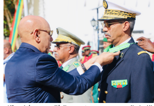
اللواء البحري، محمد شيخن الطالب مصطفى، قائد أركان البحرية الوطنية،