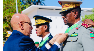
الطبيب اللواء محمد رافع، مدير للمستشفى العسكري،