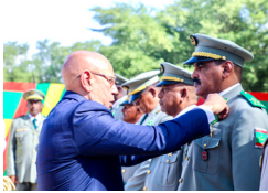
العقيد سيدي محمد حمادي، مدير العلاقات الخارجية بوزارة الدفاع الوطني،