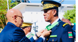
اللواء حمادي محمد أعلي محمود، قائد الأركان الجوية،