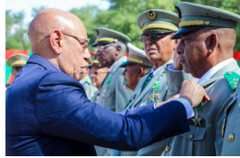
العقيد سيد أب محمد دوسو، قائد كتيبة القيادة والخدمات بالأركان العامة للجيش،